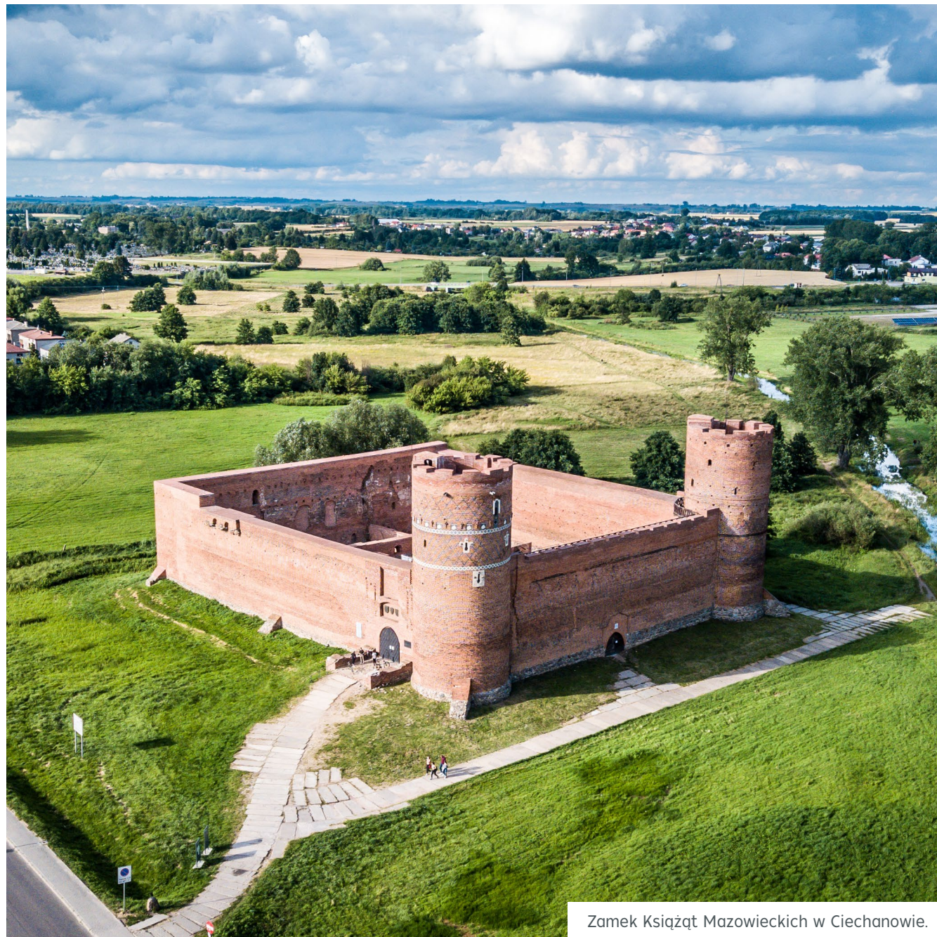
Zamek Księżąt Mazowieckich w Ciechanowie.