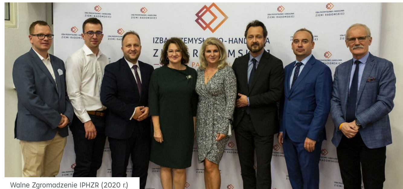
Walne Zgromadzenie IPHZR (2020 r.)